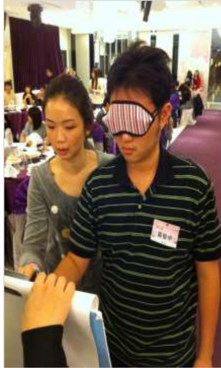
戀愛萌芽 - 你是我的眼