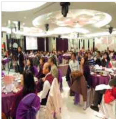
與會貴賓專注聆聽