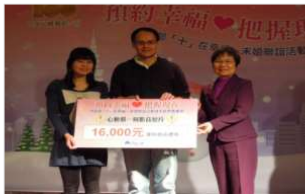
頒發支票以茲獎勵