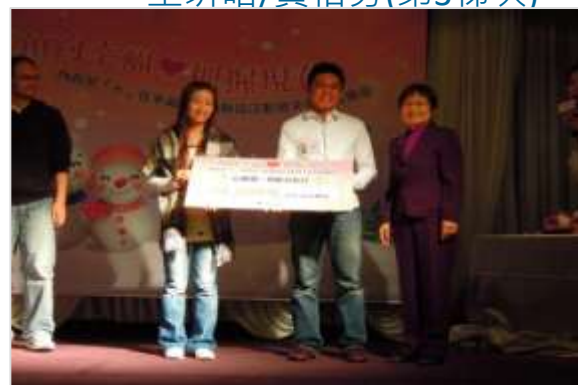
頒發支票以茲鼓勵

活動是日計有128人參加（男性為68人，女性為60人），其中，有2對是參加未婚聯誼活動後成為男女朋友，他們當天也提供3分鐘的影音短片，分享參加該聯誼活動的心得及這段感情交往的過程，將幸福分享給在場男女與會者。而這2對男女朋友，一對是100年7月9日第3梯次雪霸之參加人，另一對則為100年10月15日~16日第8梯次玉山的參加人。